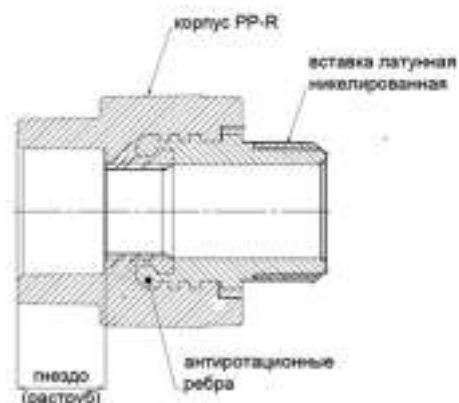
Рис.1 - Конструкции комбинированного фитинга